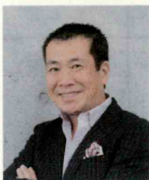
作家・ジャーナリスト 佐々木俊尚氏